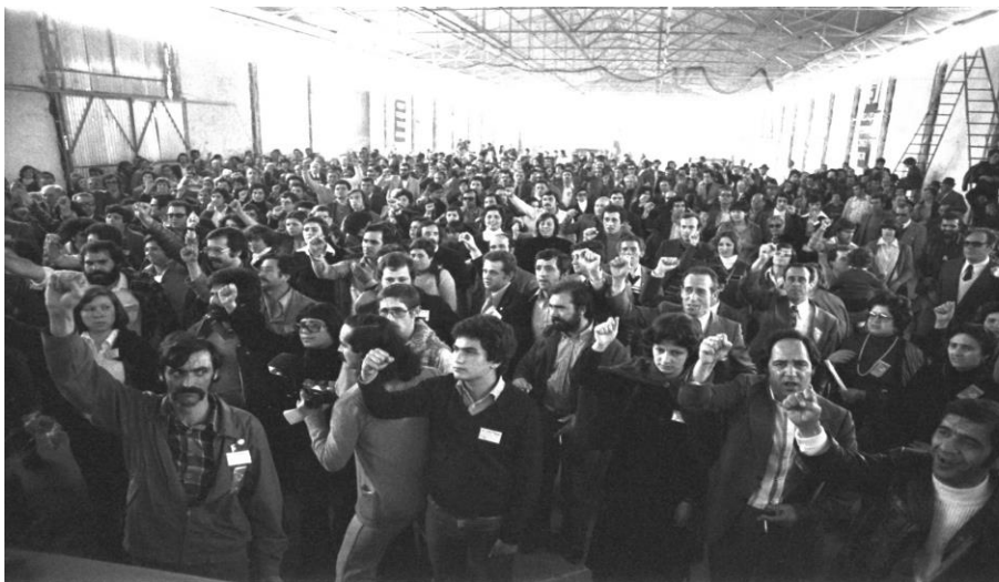
2º Congresso Covilhã

em 1979 , entre outubro e novembro, as greves dos trabalhadores do calçado nas regiões de Aveiro e Porto pela negociação coletiva sectorial e de que resultou uma vitória dos trabalhadores através de um aumento salarial significativo e a conquista do direito ao salário completo nas situações em que os trabalhadores sejam vítimas de um acidente de trabalho;